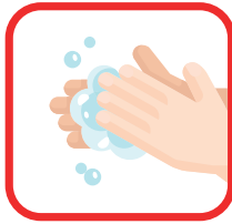
Was vaak je handen