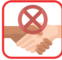
Schud geen handen