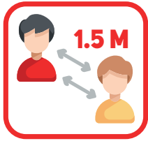
Houdt 1.5 meter ruimte

Voor iedere training/wedstrijd dient de coach na te gaan of niemand klachten heeft. Anders wordt er niet gespeeld!