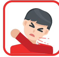
Hoest en nies in je elleboog