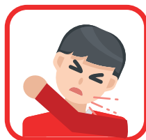
Hoest en nies in je elleboog