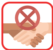
Schud geen handen