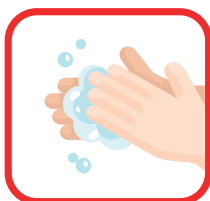
Was vaak je handen